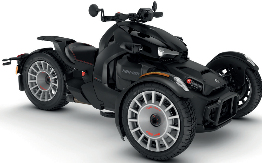
Rotax® 900 ACE™