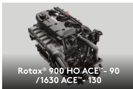
Rotax® 900 HO ACE™ - 90 /1630 ACE™ - 130

Эксклюзивная для Sea-Doo® технология iBR® позволяет остановить гидроцикл быстрее и обеспечивает лучшую маневренность на малом ходу и при движении назад.