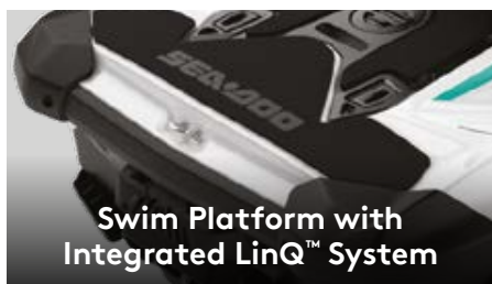
Swim Platform with Integrated LinQ™ System

Вместительное багажное отделение — это впечатляющие 152 литра защищенного от проникновения воды пространства для перевозки различных предметов.