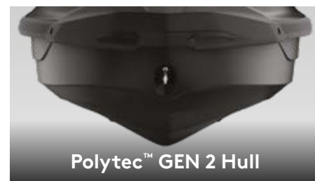
Polytec™ GEN 2 Hull

Эксклюзивный для гидроциклов Sea-Doo® режим экономии топлива , оптимизирует мощностные характеристики и позволяет достичь 46% экономии топлива. 2