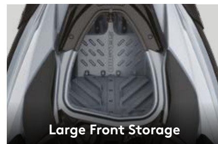
Large Front Storage

Rotax® 900 ACE™ (90 л. с.) обеспечивает живое ускорение и демонстрирует впечатляющую топливную экономичность, а для тех, кто хочет больше мощности, мы предлагаем модель с двигателем 1630 ACE™ (130 л. с.) — выдающиеся динамические характеристики и безудержное веселье.