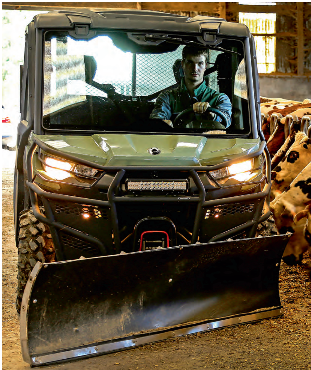
Pour l'élevage, il est très facile d'adapter un rabot à lisier sur le Traxter pour pousser les aliments dans l'étable.