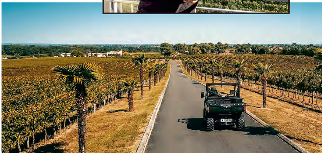
Les visites en Traxter permettent de rester en contact avec la nature.