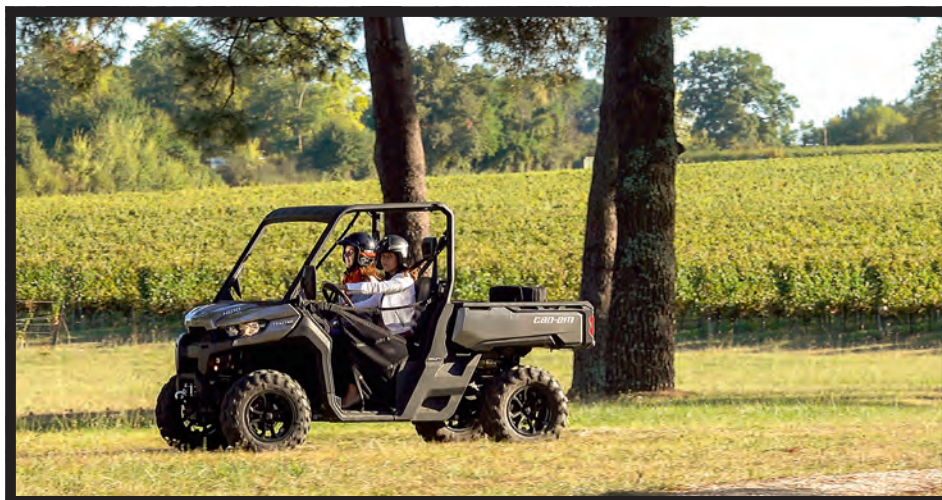
Simple à nettoyer, le Traxter se transforme rapidement en véhicule pour emmener la clientèle touristique au gîte.