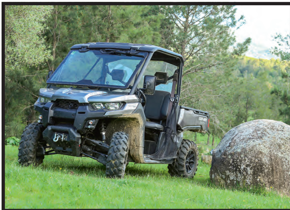
Dotée d'un esprit résolument sportif, la famille a préféré la version HD10 du Traxter.