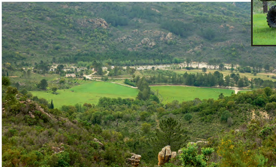
Le domaine de Pinzutella s'étend sur 80 hectares, que le Traxter parcourt avec facilité...