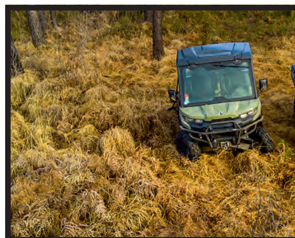
Le HD8 (à gauche) au côté du HD5 T qui a tout d'un grand, même le comportement.

puisque ses dimensions sont exactement celles des gros modèles. Le HD5 T s'appuie ainsi sur la même plateforme, avec son grand habitacle et les banquettes Versa-Pro rabattables et modulables. Cela permet soit un espace supplémentaire de chargement ou pour accueillir son chien (même s'il s'agit d'un molosse !) soit une configuration confort avec accoudoirs et même porte-gobelet pour le petit café chaud du matin... Sur notre HD5 T, nous avons ajouté le demi pare-brise (en option), qui assume parfaitement sa fonction de coupe-vent. C'est indispensable si le fond de l'air est frais... Là encore, le HD5 T bénéficie du même panel de l'ensemble des accessoires d'origine de tous les HD Can-Am; un avantage de per-