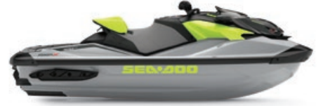
아이스 메탈 & 만타 그린