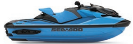
NEW 걸프스트림 블루 프리미엄