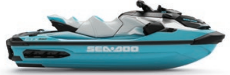
● 톨 메탈릭