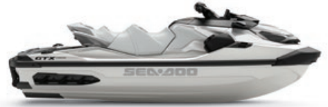
○ 화이트 펄 프리미엄