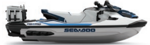
화이트 및 걸프스트림 블루