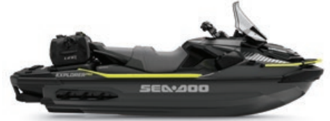
● 아이스랜드 그레이