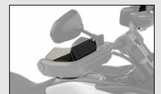
2 Обтічник щитка для захисту рук (219401186)