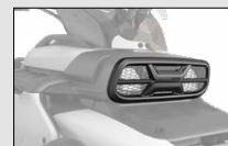
1 Захист фари (219401171)