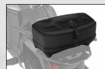
5 Спортивна сумка з системою LinQ (860202447)

Вибирайте з більш ніж 40 предметів допоміжного обладнання й аксесуарів, щоб задовольнити всі ваші потреби для наступної подорожі! Системи LinQ із точками кріплення LinQ Nano, LinQ Lite та LinQ 16" для легкого, універсального та надійного оснащення Can-Am Canyoon допоміжним обладнанням та аксесуарами.