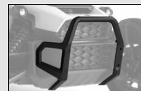
3 Передній бампер Adventure (219401193)