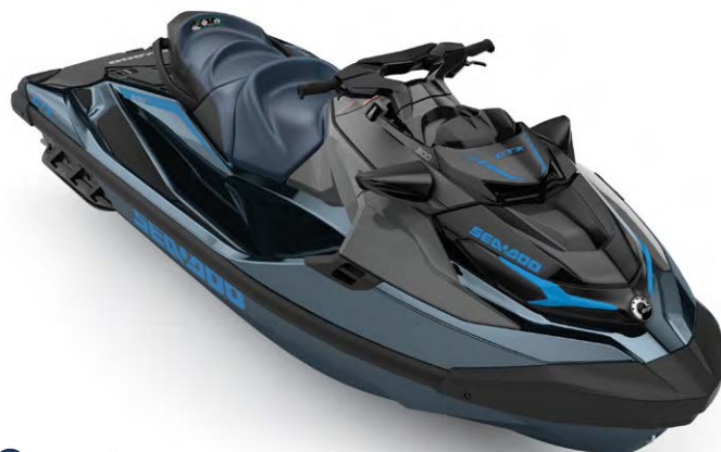
• НОВИЙ Abyss Blue / Gulfstream Blue