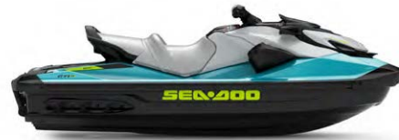
GTI™ SE 170