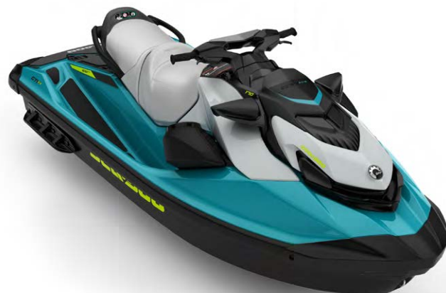
Показана модель з аудіосистемою