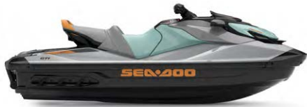
GTI™ SE 170