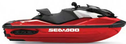
● НОВИЙ Fiery Red Premium