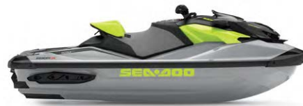
● НОВИЙ Ice Metal / Manta Green