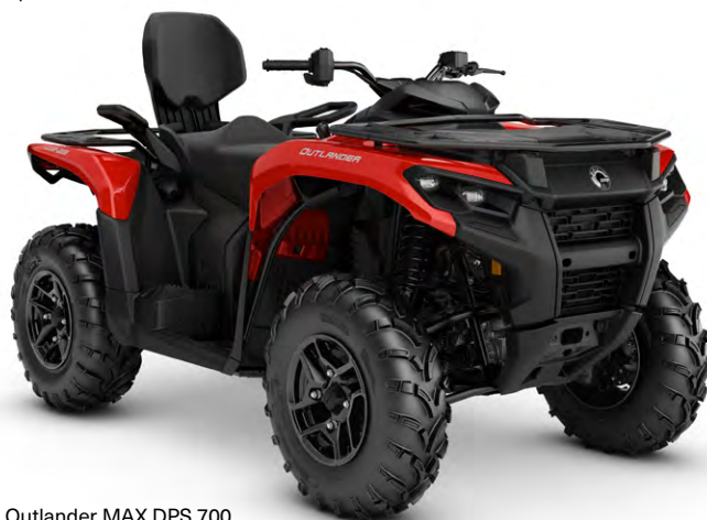
Outlander MAX DPS 700