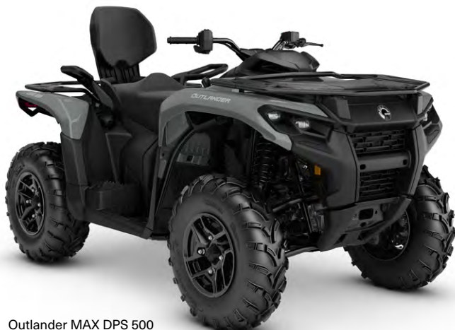
Outlander MAX DPS 500