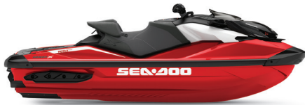
● NEW 파이어리 레드 프리미엄