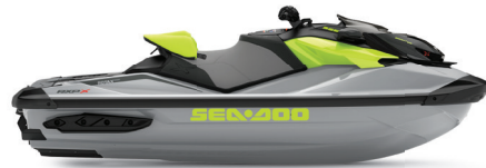
● NEW 아이스 메탈 및 만타 그린