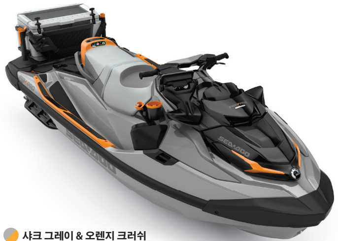
샤크 그레이 & 오렌지 크러쉬