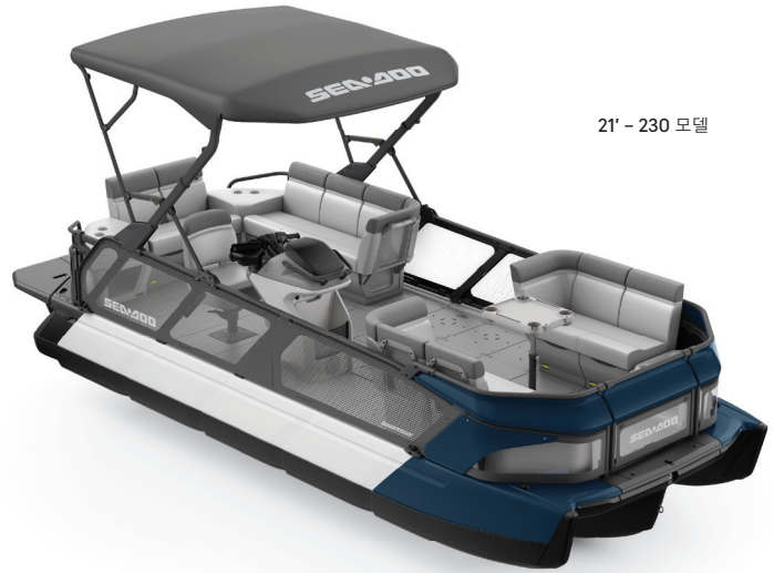
21' - 230 모델