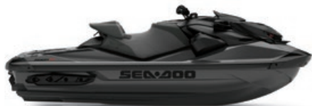
● 프리미엄트리플 블랙