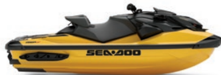
● 밀레니엄 옐로우