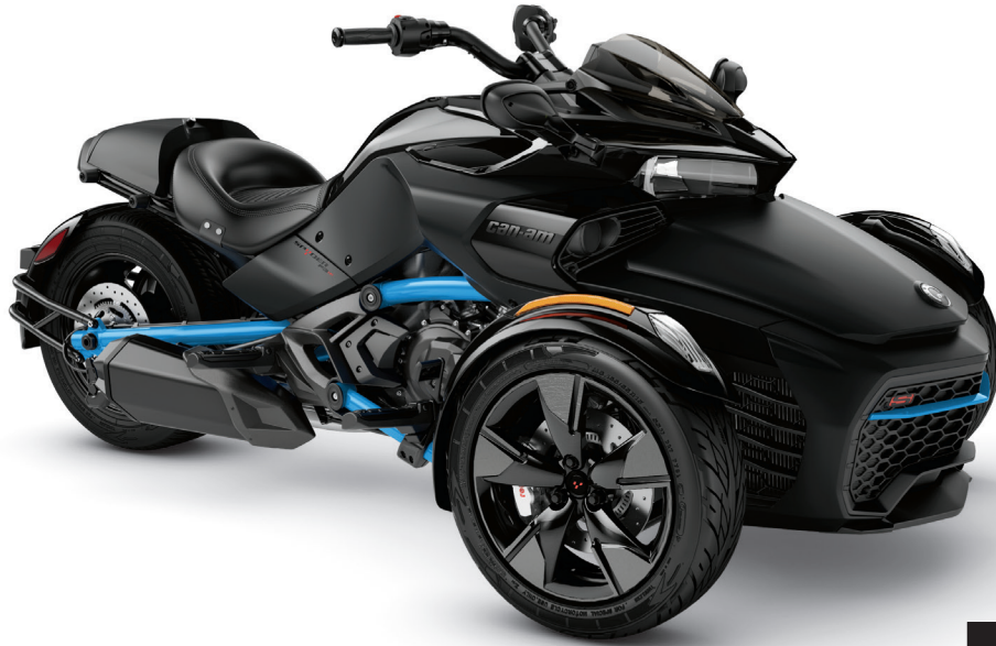
■ 모노리스 블랙 새틴(국내 출시 미정)