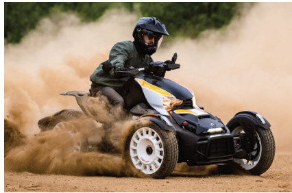
랠리만의 유니크함 어떤 종류의 도로도 갈 수 있게 만들어진 차량으로, 핸드가드, 랠리 컴포트 시트, 미끌림 방지처리가 된 조절가능한 풋 페그가 특징입니다.