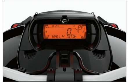
랠리 모드와 타이어 VSS 입력을 최적화하여 비포장도로에서도 유연한 주행을 가능하게 하여 재미를 더며, 올로드용 타이어로 드리프트도 할 수 있습니다.