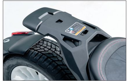
맥스 마운트 구조 옵션에 따라 적재 용량을 늘릴 수 있습니다.