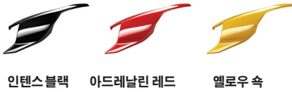
인텐스블랙 아드레날린 레드 옐로우 스피드