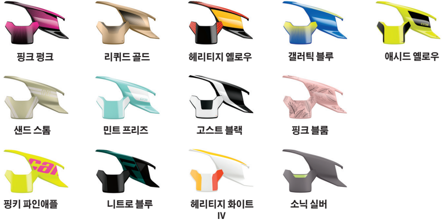
핑크 핑크 리퀴드 골드 헤리티지 옐로우 갤럭틱 블루 애시드 옐로우 샌드 스톰 민트 프리즈 고스트 블랙 핑크 블룸 핑크 파인애플 니트로 블루 헤리티지 화이트 IV 소닉 실버