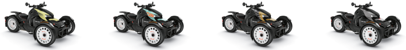
레몬 트위스트 아이스캡 블루 골드 러쉬 실버 라바