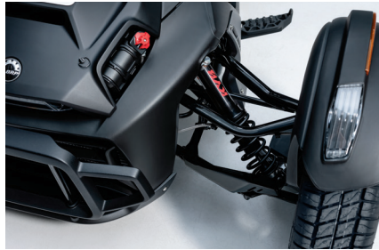
플 KYB HPG 속 시시각각 변하는 주행 환경을 위해 전후방 KYB HPG 속과 리어 리모트 어드저스터가 탑재되어 있습니다.