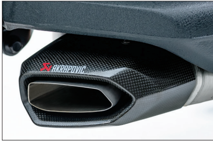
아크라포빅(AKRAPOVIC) 머플러 유니크한 시크니처 사운드를 가진 하이엔드 머플러